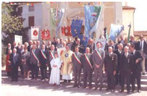
29 aprile 2001 - Fagnano di Trevenzuolo fondata dal prof. Alessandro Canestrari , famoso depu-

La prossima manifestazione sarà a settembre nella splendida cornice consigliere di Palazzo Carlotti, sede del consiglio comunale di Caprino Veronese. Infine il 22 settembre 2001 a Casale Monferrato si svolgerà l'Assemblea Generale Annuale dell'AIOC (Milano 2001) dove si terranno le elezioni per la nomina del presidente (internazionale).